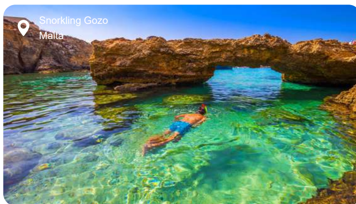
Snorkling Gozo Malta

Malta er en lille øgruppe bestående af 7 øer, hvoraf de 3 – hovedøen Malta samt Gozo og Comino – er beboet. Med sin strategiske beliggenhed mellem Nordafrika og Italien har Malta igennem århundreder været eftertragtet jord, og herredømmet over øerne har skiftet hænder flere gange igennem historien, hvilket har sat sit præg på både sproget, gastronomien og arkitekturen. Maltesisk er således afledt af arabisk blandet med italiensk, mens middelhavskøkkenet blandes med det nordafrikanske. Malteserne er også meget stolte af de legendariske riddere, der forsvarede øen mod tyrkerne og lancerede korstogene. Disse riddere går under mange navne, hvoraf Johanniterordenen og Malteserordenen er de mest kendte. Det var en af ordenens stormestre, der grundlagde Valletta og gjorde byen til hovedstad i midten af 1500-tallet, og mange af byens for øvrigt meget smukke barokke bygninger stammer fra denne tid. På trods af sin beskedne størrelse er Valletta spækket med historisk interessante seværdigheder, hvoraf den imponerende katedral og Stormesterens Palads skal fremhæves sammen med et par museer, der fortæller den spændende historie om ridderne og deres bedrifter. Valletta, der er Europas sydligste og EU's mindste hovedstad, er optaget på UNESCO's Verdensarvsliste, og den er en yderst betagende by at vandre rundt i, da den emmer af historie og romantik.