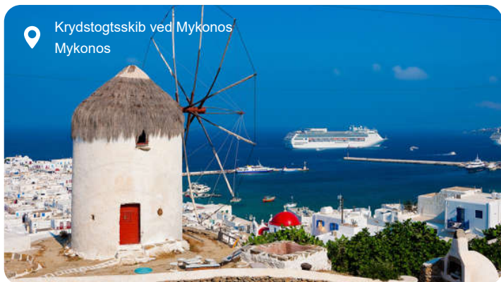
Krydstogtsskib ved Mykonos Mykonos