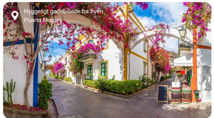
Hyggeligt gadebillede fra byen Puerto Mogan

Igennem flere årtier har Gran Canaria været blandt danskernes foretrukne rejsemål i vinterhalvåret med sit behagelige klima og sine skønne sandstrande. De høje sanddyner i Maspalomas på øens sydside leder tankerne hen på Sahara, men bestiger du en af dynerne, har du her udsigten til det blå Atlanterhav. Las Palmas er en ganske stor by, hvor du godt kan miste overblikket, men fra Santa Ana katedralens sydlige tårn har du en eminent udsigt over hele byen, hvor der er rigtig gode muligheder for at shoppe. Bare 20 km herfra finder du Gran Canarias ældste og - ifølge mange - smukkeste by: Teror. Den er beliggende i en malerisk dal mellem grønne bjergkammer og fortryller med smukke, historiske huse i alle regnbuens farver. En anden besøgs værdig by er charmerende Puerto de Mogan, der også kaldes Lille Venedig grundet de pittoreske broer og vandindløb, der blander sig med husene i typisk Middelhavsstil.