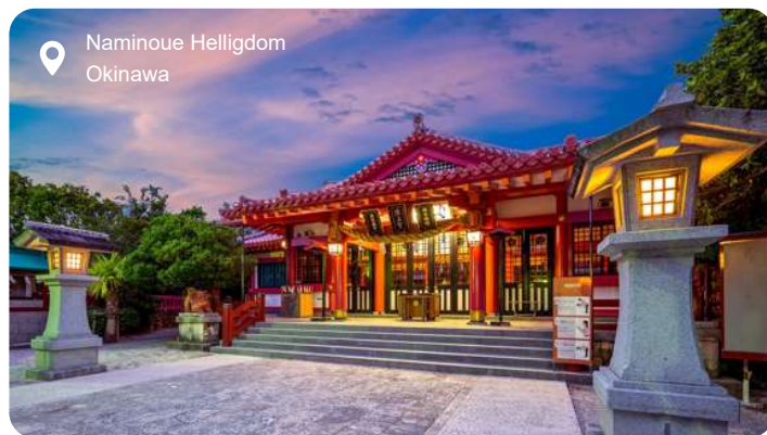
Naminoue Helligdom Okinawa

Okinawa er Japans tropiske øgruppe, hvor havet glitrer i nuancer af turkis og blå, og palmeklædte strande danner kontrast til den krigshistorie og særprægede kultur, som præger øen. Her lægges der til i hovedbyen Naha - en moderne, men charmerende storby med skyskrabere, monorail og mindesmærker, der vidner om øens dramatiske fortid. Under Anden Verdenskrig blev byen næsten jævnet med jorden under det blodige slag om Okinawa, hvor titusindvis af civile mistede livet. Du kan stadig gå gennem de smalle tunneler under jorden, hvor den japanske hærs hovedkvarter lå, og se de spartanske rum præcis som de blev forladt. Historien stopper dog ikke her. Okinawa var tidligere hjem for det selvstændige Ryukyu-rige, og øens kulturelle særpræg lever videre i maden, musikken og arkitekturen. Hele ni steder på UNESCO's verdensarvsliste fortæller om denne arv, heriblandt det rødglødende Shuri-slot, det fredfyldte Tamaudun-mausoleum og Shikinaen-haven med sine buede tage og lotusdamme. Du kan også tage uden for byen og opleve koralrev, havskildpadder og landsbyer, hvor der stadig spilles på det traditionelle strengeinstrument, shamisen, og kvinder væver i hånden. Okinawa føles som Japan i en blødere udgave - med egen identitet, et varmt hai sai i stedet for det formelle konnichiwa , og en historie, der går dybt under huden.