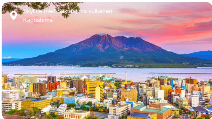
Skyltline med Sakurajima vulkanen Kagoshima