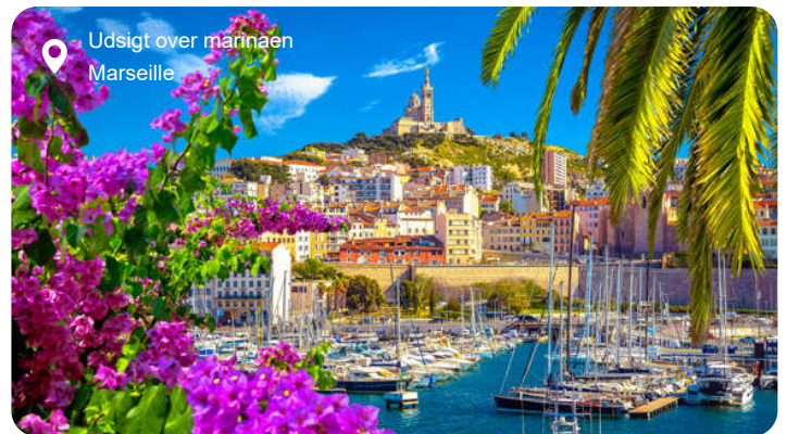
Udsigt over marnnaen Marseille

Marseille er den største havn i Middelhavet og Frankrigs andenstørste by. Den er en sand smeltedigel af forskellige folk og kulturer og anses for at være en bro mellem Europa og Nordafrika. Det er en by, der er perfekt til bare at vandre omkring og indsnuse atmosfæren, mens man beundrer de arkitektoniske perler. I den maleriske gamle havn ligger yachts- og fiskerbåde side om side, og lige nord herfor finder du den historiske del af byen, Le Panier, hvis virvar af snørklede og stejle gader gemmer på små, skjulte pladser og gamle, høje huse med terrasser, hvor vasketøjet hænger til tørre. Ud for kysten domineres vignet af det berygtede Château d'If – fængslet på en lille klippeø, hvorfra Greven af Monte Cristo flygtede i Alexandre Dumas' berømte roman. Fra Marseille kan du også udforske smukke og historisk interessante Arles og pavernes gamle by Avignon.