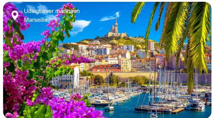
Udsigt over marnaaen Marseille

Marseille er den største havn i Middelhavet og Frankrigs andenstørste by. Den er en sand smeltedigel af forskellige folk og kulturer og anses for at være en bro mellem Europa og Nordafrika. Det er en by, der er perfekt til bare at vandre omkring og indsnuse atmosfæren, mens man beundrer de arkitektoniske perler. I den maleriske gamle havn ligger yachts- og fiskerbåde side om side, og lige nord herfor finder du den historiske del af byen, Le Panier, hvis virvar af snørklede og stejle gader gemmer på små, skjulte pladser og gamle, høje huse med terrasser, hvor vasketøjet hænger til tørre. Ud for kysten domineres vignet af det berygtede Château d'If – fængslet på en lille klippeø, hvorfra Greven af Monte Cristo flygtede i Alexandre Dumas' berømte roman. Fra Marseille kan du også udforske smukke og historisk interessante Arles og pavernes gamle by Avignon.