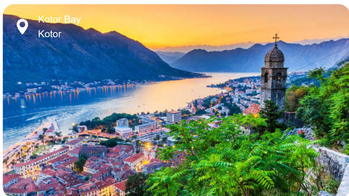
Kotor Bay Kotor