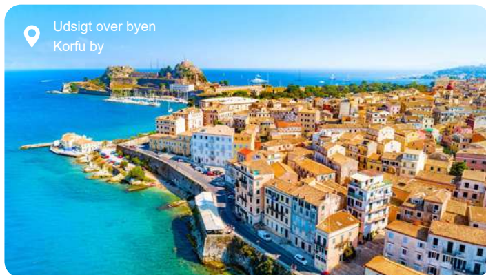
Udsigt over byen Korfu by

Korfus frodige flora tæller oliven- og appelsintræer samt cypresser i overflod. Gå en tur i de smalle gader i den muromkransede, gamle bydel med yndige pastelfarvede venetianske bygninger og besøg villaen, Achilleion, der var Prinsesse Sissi af Østrigs hjem. Hendes paradis er udsmykket med overdådige freskomalerier, dekoreret med klassiske motiver fra den græske mytologi og omkranset af storslåede haver. Neo Frourio er et arkitektonisk interessant fort med dystre fangekælder, en labyrint af løbegange med kamre og trapper samt en storslået udsigt over byen og bugtens dramatiske kystlinje.