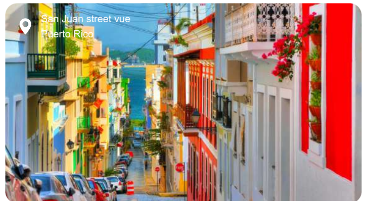
San Juan street vue Puerto Rico

Farverige huse med smedejernsbalkoner, brostensbelagte gader og bymure dækket af klatreplanter - San Juans gamle bydel emmer af kolonitid og caribisk charme. Her kan du gå en tur langs Paseo del Morro og se ud over Atlanterhavet, mens du nærmer dig det mægtige fæstningsværk Castillo San Felipe del Morro, der blev bygget af spanierne i 1500-tallet for at beskytte øen mod pirater. Bag de tykke mure gemmer sig kanoner, udkigstårne og en svimlende udsigt over kysten. Inde i byen lokker små gallerier, caféer og livlige pladser med gadekunst og musik, og i baggrunden står den gamle San Juan-katedral, hvor den spanske opdagelsesrejsende Juan Ponce de León ligger begravet. Vil du lidt uden for byens mure, kan du tage på en kort køretur til regnskoven El Yunque, hvor smalle stier fører dig gennem tågeskov, forbi vandfald og lianer, mens papegøjer og små frøer spiller op fra trækroneerne. Eller du kan kaste dig i bølgerne ved Condado-stranden og mærke den varme brise, som kun Puerto Rico kan levere.