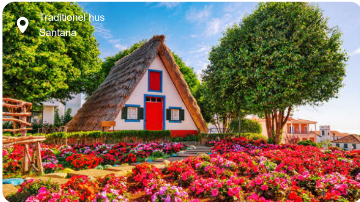
Traditionel hus Santana