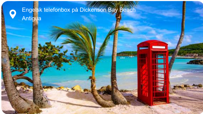
Engelsk telefonbox på Dickenson Bay Beach Antigua