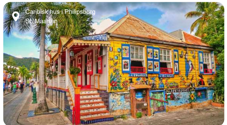
Caribisk hus i Philipsburg St. Maarten

Farvestrålende huse i kolonistil, glitrende butikker og turkisblåt hav danner rammen om Philipsburg, hovedbyen på den hollandske del af St. Maarten. Den kompakte by ligger som en perle mellem to bugter og er let at udforske til fods. Langs strandpromenaden, Boardwalk, venter bløde sandstrande, palmer og caféer, mens Front Street bagved byder på caribisk stemning og toldfri shopping i alt fra smykker til parfume og elektronik. Vil du dykke dybere ned i øens historie, kan du besøge Fort Amsterdam, der blev opført af hollænderne i 1600-tallet og stadig vogter over bugten med kanoner og udsigt. Længere inde i landet lokker de grønklædte bakker og små landsbyer, og på en udflugt kan du opleve både den franske og hollandske del af øen på én dag. Et højdepunkt for mange er et besøg ved Maho Beach, hvor fly fra hele verden lander blot få meter over hovedet på badegæster - en oplevelse, der er lige dele adrenalinus og turistmagi. Øen rummer også rolige laguner, kreolske fiskeretter og små kunstgallerier, og trods sin beskedne størrelse føles St. Maarten som en hel lille verden - med kontraster, charme og caribisk lethed.