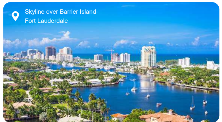
📍 Skyline over Barrier Island Fort Lauderdale

Fort Lauderdale er især kendt for sine lange, palmefyldte strande og det netværk af kanaler, der har givet byen tilnavnet "Amerikas Venedig". Men bag strandstolene og de luksuriøse yachter gemmer der sig en by med mange ansigter. Du kan tage på kanalrundfart med vandtaxa og opleve de eksklusive kvarterer fra vandsiden, hvor elegante villaer og grønne haver spejler sig i det rolige vand. I centrum frister Las Olas Boulevard med sin afslappede stemning, kunstgallerier, caféer og butikker i alle afskygninger, og du kan nemt bruge timer på at udforske gaden til fods. Vil du dykke dybere ned i kulturen, er det værd at besøge det historiske Bonnet House med tropisk have og et glimt af Floridas kunstnerliv i begyndelsen af 1900-tallet. For naturelskere er Everglades kun en kort køretur væk – her kan du suse gennem sumpen i airboat og spotte alligatorer og farvestrålende fugle i det vidtstrakte vådland.