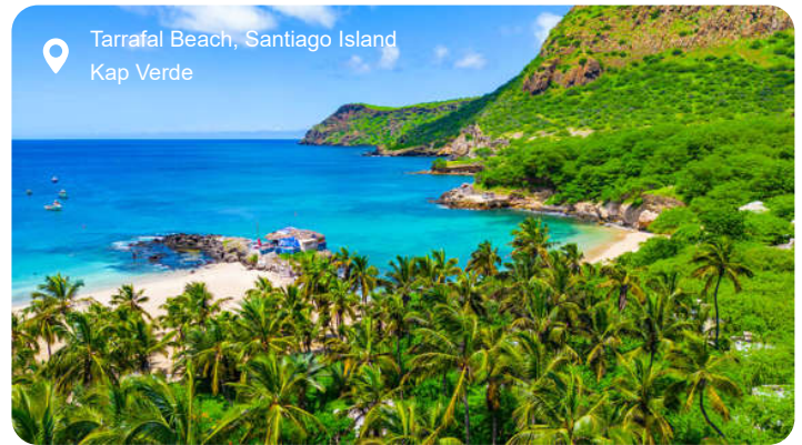
Tarrafal Beach, Santiago Island Kap Verde

Praia, hovedstaden på Kap Verdes ø Santiago, er en livlig blanding af afrikanske rytmer, portugisisk kolonihistorie og rå vulkansk natur. Byens historiske kerne, Plateau, troner på en klippetop og rummer farverige bygninger, små kirker, palmeklædte pladser og udsigtpunkter med blikke ud over Atlanterhavet. På byens markeder summer det af liv, og du møder alt fra frisk tun til lokalt håndværk, mens rytmerne fra morna-musikken flyder mellem boderne. En kort køretur uden for byen fører dig gennem et landskab af lavabjerge, sukkerrør og baobabtræer, hvor små landsbyer ligger som perler i det tørre terræn. Du kan besøge den historiske by Cidade Velha – Kap Verdes første hovedstad og UNESCO-verdensarv – med sine brostensgader, gamle fæstning og kirker, der fortæller om kolonitidens blandede arv. Undervejs passerer du dybe kløfter og frodige dale, hvor bananer, papaya og majs gror side om side. Øen har få strande, men ved Quebra Canela i udkanten af Praia finder du både sand og surf – og en afslappet lokal stemning.