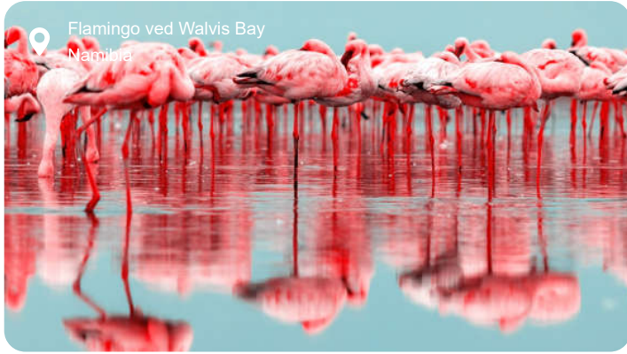
Flamingo ved Walvis Bay Namibia