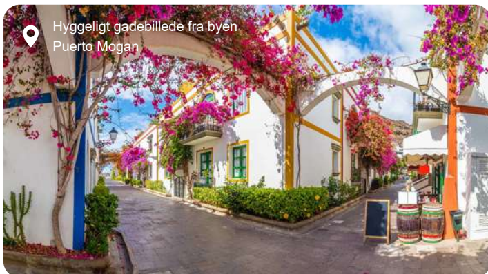
Hyggeligt gadebillede fra byen Puerto Mogán

Igennem flere årtier har Gran Canaria været blandt danskernes foretrukne rejsemål i vinterhalvåret med sit behagelige klima og sine skønne sandstrande. De høje sanddyner i Maspalomas på øens sydside leder tankerne hen på Sahara, men bestiger du en af dynerne, har du her udsigten til det blå Atlanterhav. Las Palmas er en ganske stor by, hvor du godt kan miste overblikket, men fra Santa Ana katedralens sydlige tårn har du en eminent udsigt over hele byen, hvor der er rigtig gode muligheder for at shoppe. Bare 20 km herfra finder du Gran Canarias ældste og - ifølge mange - smukkeste by: Teror. Den er beliggende i en malerisk dal mellem grønne bjergkamme og fortryller med smukke, historiske huse i alle regnbuens farver. En anden besøgs værdig by er charmerende Puerto de Mogán, der også kaldes Lille Venedig grundet de pittoreske broer og vandindløb, der blander sig med husene i typisk Middelhavsstil.