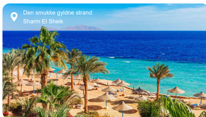
Den smukke gyldne strand Sharm El Sheik

Langs kysten syd for Suez begynder et landskab, hvor ørkenens varme sten møder Det Røde Havs klare farver. Sokhna er præget af brede strande, lavt vand og moderne resortområder, men det er kontrasten mellem hav og bjergørken, der gør området særligt: én vej fører mod det dybblå hav, en anden ind i et barskt indre, hvor klipperne står i røde og mørke nuancer og danner ramme om nogle af Egyptens ældste kristne traditioner. Dybt inde mellem bjergene ligger St. Anthony-klosteret, der er et af verdens allerældste klostre. Munkene har levet her siden 300-tallet, omgivet af mure, hvælvede kirkerum og fresker, der bærer spor af både romersk og koptisk historie. Stilheden i dalen er markant, og klosterkomplekset giver et usædvanligt klart indblik i den tidlige kristendom i Mellemøsten. For mange fungerer Sokhna også som udgangspunkt for en dag i Cairo. Turen gennem ørkenen fører direkte ind i en af verdens mest intense storbyer, hvor Det Egyptiske Museum rummer faraonernes skatte, og Nilens bredder deler det moderne Cairo fra de ældre kvarterer. Og ude på Giza-plateauet står pyramiderne og Sfinksen i det støvede landskab, som de har gjort i tusinder af år - et syn, der altid overgår billederne, uanset hvor mange gange du har set dem.