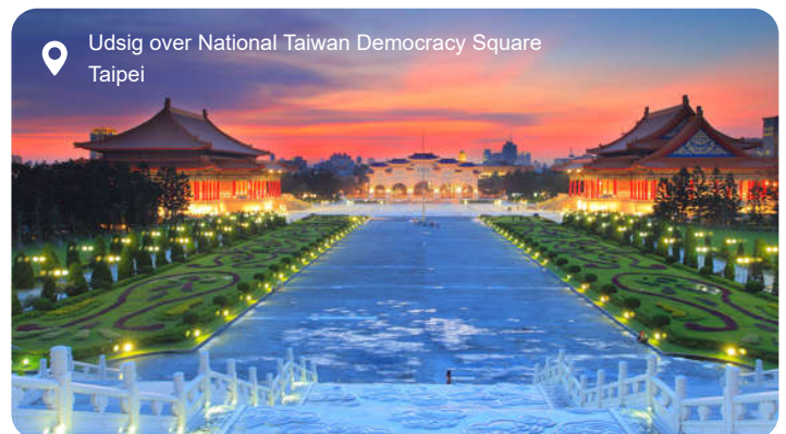
Udsigt over National Taiwan Democracy Square Taipei

Mørkegrønne bjergskrånninger omfavner havnen i Keelung, hvor skyskrabere, templer og fiskehaller spejler sig i det skiftende lys over havet. Ved havnefronten blander duften af saltvand og frisk fisk sig med røgelse fra det smukke Dianji-tempel, hvis røde søjler og gulddetaljer danner en fredfyldt kontrast til det livlige bybillede. En udflugt til det særprægede Yehliu Geopark vest for byen fører dig til et landskab, hvor vind og hav har skabt klippeformationer, der ligner skulpturer – heriblandt den berømte "Queen's Head". Ikke langt fra Keelung ligger Taipei, som nås på under en time med tog og åbner døren til Taiwans moderne puls og kulturelle dybde. Her kan du besøge det storslåede National Palace Museum, der rummer en af verdens fineste samlinger af kinesisk kunst, eller tage elevatoren op i Taipei 101 og skue ud over storbyen fra det ikoniske tårns 89. etage. Chiang Kai-shek Memorial Hall og Longshan-templet vidner om øens dramatiske historie og spirituelle rødder, mens grønne oaser som Elephant Mountain og Da'an Park inviterer til ro og udsigt. Keelung fungerer som et stemningsfuldt udgangspunkt, hvorfra både kystens naturkræfter og hovedstadens kulturskatte kan opleves.