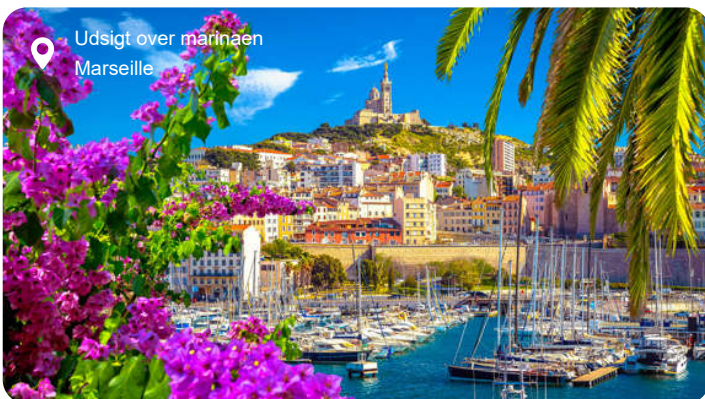
Udsigt over marinaen Marseille

Marseille er den største havn i Middelhavet og Frankrigs andenstørste by. Den er en sand smeltedigel af forskellige folk og kulturer og anses for at være en bro mellem Europa og Nordafrika. Det er en by, der er perfekt til bare at vandre omkring og indsnuse atmosfæren, mens man beundrer de arkitektoniske perler. I den maleriske gamle havn ligger yachts- og fiskerbåde side om side, og lige nord herfor finder du den historiske del af byen, Le Panier, hvis virvar af snørklede og stejle gader gemmer på små, skjulte pladser og gamle, høje huse med terrasser, hvor vasketøjet hænger til tørre. Ud for kysten domineres vyet af det bergtede Chateau d'If – fængslet på en lille klippeø, hvorfra Greven af Monte Cristo flygtede i Alexandre Dumas' berømte roman. Fra Marseille kan du også udforske smukke og historisk interessante Arles og pavernes gamle by Avignon.