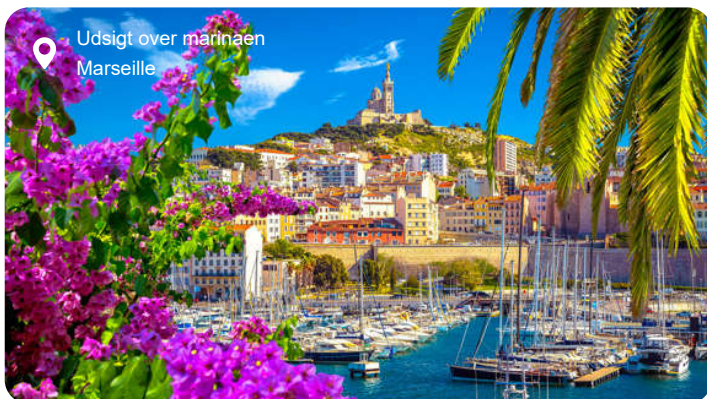
Udsigt over marinaen Marseille

Marseille er den største havn i Middelhavet og Frankrigs andenstørste by. Den er en sand smeltedigel af forskellige folk og kulturer og anses for at være en bro mellem Europa og Nordafrika. Det er en by, der er perfekt til bare at vandre omkring og indsnuse atmosfæren, mens man beundrer de arkitektoniske perler. I den maleriske gamle havn ligger yachts- og fiskerbåde side om side, og lige nord herfor finder du den historiske del af byen, Le Panier, hvis virvar af snørklede og stejle gader gemmer på små, skjulte pladser og gamle, høje huse med terrasser, hvor vasketøjet hænger til tørre. Ud for kysten domineres vyet af det beryggede Chateau d'If – fængslet på en lille klippeø, hvorfra Greven af Monte Cristo flygtede i Alexandre Dumas' berømte roman. Fra Marseille kan du også udforske smukke og historisk interessante Arles og pavernes gamle by Avignon.