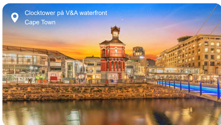
Clocktower på V&A waterfront Cape Town

Cape Town er en af verdens mest spektakulært beliggende byer, klemmt inde mellem det ikoniske Table Mountain og det dybblå Atlanterhav. Her mødes historie, kultur og natur i en farverig blanding, hvor du kan opleve alt fra det vibrerende marked på Greenmarket Square til det stemningsfulde Bo-Kaap-kvarter med sine pastelfarvede huse og duft af krydderier fra Malay-køkkenet. En tur med svævebanen op på Table Mountain belønner dig med en uforglemmelig udsigt over byen og bugten, mens en båd tur til Robben Island fortæller den stærke historie om Nelson Mandela og kampen mod apartheid. Langs kysten venter dramatiske naturscenerier og hyggelige strandbyer som Camps Bay og Hout Bay, og følger du Chapman's Peak Drive, snor vejen sig langs klippesider højt over havet med stop ved udsigtspunkter, hvor du nærmest taber vejret. Du kan også tage til Kap Det Gode Håb, hvor de to verdenshave mødes i et brus af bølger, og hvor du måske møder strudse og bavianer på din vej. På hjemturen frister vinlandet med frodige vinmarker, historiske vingårde og smagninger af sydafrikanske vine i solbeskinnede omgivelser. Cape Town er kontrastfyldt, dragende og storslået – en by der sætter sig i både kroppen og hjertet.