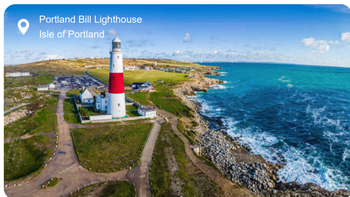
Portland Bill Lighthouse Isle of Portland

Portland rejser sig som en massiv blok af kalksten ud for Dorsets kyst - et rått klippelandskab, der i århundreder leverede den Portland-kalksten, som blev brugt til alt fra St. Paul's Cathedral i London til FN-bygningen i New York. Sporene efter stenbruddene ligger stadig åbne i terrænet, og de snorlige skæringer i klipperne giver øen et særpræget, næsten skulpturelt udtryk. På øens sydspids står det rød-hvide Portland Bill Lighthouse vendt mod et havområde, hvor stærke strømme og revler har sendt mange skibe i vanskeligheder. Længere oppe ligger Portland Castle, der blev opført af Henrik 8. som led i hans forsvar mod de europæiske stormagter - et kompakt, velbevaret fort, der stadig bærer tydelige spor af Tudor-tidens militære arkitektur. Portland er samtidig porten til Jurassic Coast, der er en af Englands mest markante kyststrækninger. Her ligger klinterne i lag som siderne i en geologisk historiebog, og få kilometer mod øst findes både Durdle Door og Lulworth Cove, hvor erosion gennem årtusinder har formet naturens egne vartegn. Og på den smalle landtange, der forbinder Portland med fastlandet, strækker Chesil Beach sig i næsten 30 kilometer. Rullestenene ligger sorteret i størrelser af naturkræfterne selv - store sten i den ene ende, små i den anden - og det lange, buede strandbånd er et af de mest særprægede steder i hele Sydengland.