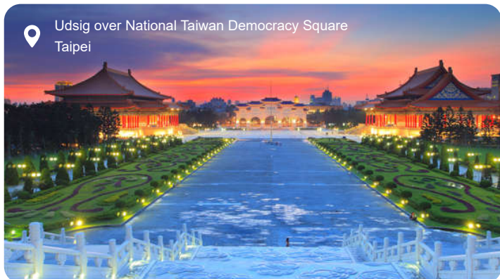
Udsigt over National Taiwan Democracy Square Taipei