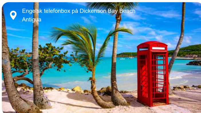
Engelsk telefonbox på Dickenson Bay Beach Antigua

Farverige træhuse med udskårne verandaer, afskallede facader og bliktag i rødt og turkis sætter kulør på St. John's, Antiguas lille, livlige hovedby. Byens centrum er overskueligt og levende, og her finder du både kolonihistoriske bygninger og små lokale museer, som giver et indblik i øens britiske arv og afrocaribiske kultur. I havnen ligger farverige fiskerbåde side om side med store krydstogtskibe, og fra den lille promenade er der udsigt over Det Caribiske Hav klare blå nuancer. Ikke langt fra byen ligger nogle af Antiguas største seværdigheder: Nelson's Dockyard i English Harbour er en velbevaret flådebase fra 1700-tallet, hvor du kan gå mellem gamle stenhuse og mastekraner og få et glimt af livet under Royal Navy. Området er på UNESCO's verdensarvsliste og oser af maritim historie. Kører du videre op ad bjergvejene, når du til Shirley Heights, der er en tidligere udkigspost med storslået udsigt over bugten og havet. Øen er kendt for sine mange strande - faktisk én for hver dag i året, som man siger - og du finder alt fra stille laguner til strækninger med bølger og liv. Antigua er rig på historie, men det er også en ø, hvor rytmen er afslappet, og naturen altid lige om hjørnet.