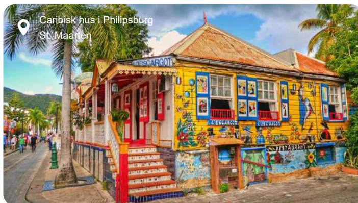
Caribisk hus i Philipsburg St. Maarten

Farvestrålende huse i kolonistil, glitrende butikker og turkisblåt hav danner rammen om Philipsburg, hovedbyen på den hollandske del af St. Maarten. Den kompakte by ligger som en perle mellem to bugter og er let at udforske til fods. Langs strandpromenaden, Boardwalk, venter bløde sandstrande, palmer og caféer, mens Front Street bagved byder på caribisk stemning og toldfri shopping i alt fra smykker til parfume og elektronik. Vil du dykke dybere ned i øens historie, kan du besøge Fort Amsterdam, der blev opført af hollænderne i 1600-tallet og stadig vogter over bugten med kanoner og udsigt. Længere inde i landet lokker de grønklædte bakker og små landsbyer, og på en udflugt kan du opleve både den franske og hollandske del af øen på én dag. Et højdepunkt for mange er et besøg ved Maho Beach, hvor fly fra hele verden lander blot få meter over hovedet på badegæster - en oplevelse, der er lige dele adrenalinus og turistmagi. Øen rummer også rolige laguner, kreolske fiskeretter og små kunstgallerier, og trods sin beskedne størrelse føles St. Maarten som en hel lille verden - med kontraster, charme og caribisk lethed.