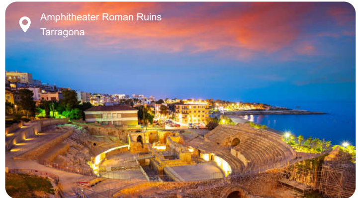
Amfiteater Roman Ruins Tarragona

I Tarragona falder Middelhavets lys på ruiner fra Romerriget og giver historien en nærmest fysisk tilstedeværelse. Midt i byen ligger resterne af amfiteatret, hvor gladiatorer engang kæmpede med havet som bagtæppe, og tæt ved står den store akvædukt Pont del Diable, der stadig spænder sin bue over dalen med imponerende præcision. I den middelalderlige bydel snor smalle gader sig mellem bagerduft og kaffe, og små pladser folder sig ud med springvand og caféborde i skyggen. Katedralens gotiske facade rejser sig over byens tage, og bag murene gemmer klostergården på århundreders håndværk i sine fint udskårne kapitæler. Nede ved havnen summer strandpromenaden af liv, og Platja del Miracle - Mirakelstranden - ligger kun få skridt fra de gamle ruiner. Lidt længere nede ad kysten finder du den gamle fiskerbydel El Serrallo, hvor dagens fangst stadig landes og serveres på små, enkle restauranter som et levende minde om Tarragonas maritime rødder.