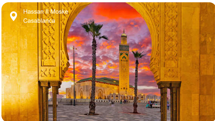
Hassan II Moske Casablanca

Casablanca er nok Marokkos mest moderne by men med en rig fransk kolonihistorie. Byen anses af mange som en hellig by grundet en overflod af historiske moskéer og velbevaret maurisk og islamisk arkitektur. Det mest iøjnefaldende bygningsværk er den enorme Hassan II Moské, som ligger helt ned til vandet. Helligdommen er sirligt udsmykket både ud- og indvendigt med indgraveret og udskåren religiøs ikonografi, har en af verdens højeste minareter og kan rumme 25.000 tilbedere. Souken er det perfekte sted at finde en souvenir til dig selv eller andre. De smalle gader rummer små boder, der sælger alt fra eksotiske krydderier og myntete til mønstrede tæpper og lædertasker, og her er et leben uden lige, så selvom du ikke køber noget, er det en oplevelse for alle sanserne. Fra Casablanca har du også mulighed for at besøge en af de gamle, stolte kongebyer Fez og Marrakech med de fortryllende medinaer og berberstemning.