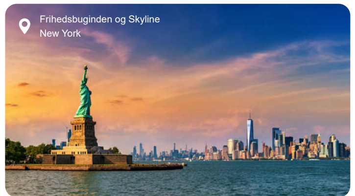
Frihedsgudinden og Skyline New York

New York er indbegrebet af storby, og alene byens skyline er nok til at vække forventning. Men bag skyskrabernes glas og stål gemmer der sig et utal af stemninger og oplevelser, der spænder fra det pulserende til det næsten poetiske. En dag her kan føre dig fra Central Parks grønne åndehul og ud til Hudson River med udsigt til Frihedsgudinden, og videre gennem kvarterer med hver deres karakter – fra de brostensbelagte gader i SoHo til Harlem med sine gospeltoner og Little Italy med duften af friskbagt focaccia. Du kan lade dig forføre af stemningen på en klassisk diner, mærke historiens vingesus ved 9/11 Memorial, tage op i Empire State Building og se byen glitre i alle retninger, eller lade dig opsluge af kunst på MoMA og gallerier i Chelsea. Times Square lyser hele døgnet, mens Brooklyn lokker med street art, vintagebutikker og kreative caféer. Er du til kontraster, kan du stå midt på Wall Street om formiddagen og vandre på den grønne, forhøjede High Line om eftermiddagen. Og selvom tempoet er højt, er der øjeblikke, hvor byen føles næsten intim – som når jazzmusikken flyder ud fra en bar i Greenwich Village, eller når solen farver bygningerne gyldne ved solnedgang.