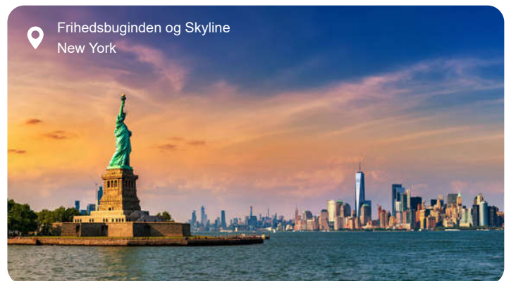
Frihedsgudinden og Skyline New York

New York er indbegrebet af storby, og alene byens skyline er nok til at vække forventning. Men bag skyskrabernes glas og stål gemmer der sig et utal af stemninger og oplevelser, der spænder fra det pulserende til det næsten poetiske. En dag her kan føre dig fra Central Parks grønne åndehul og ud til Hudson River med udsigt til Frihedsgudinden, og videre gennem kvarterer med hver deres karakter – fra de brostensbelagte gader i SoHo til Harlem med sine gospeltoner og Little Italy med duften af friskbagt focaccia. Du kan lade dig forføre af stemningen på en klassisk diner, mærke historiens vingesus ved 9/11 Memorial, tage op i Empire State Building og se byen glitre i alle retninger, eller lade dig opsluge af kunst på MoMA og gallerier i Chelsea. Times Square lyser hele døgnet, mens Brooklyn lokker med street art, vintagebutikker og kreative caféer. Er du til kontraster, kan du stå midt på Wall Street om formiddagen og vandre på den grønne, forhøjede High Line om eftermiddagen. Og selvom tempoet er højt, er der øjeblikke, hvor byen føles næsten intim – som når jazzmusikken flyder ud fra en bar i Greenwich Village, eller når solen farver bygningerne gyldne ved solnedgang.