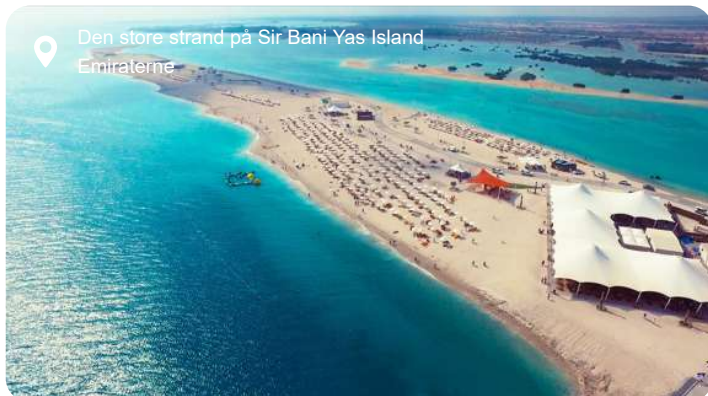
Den store strand på Sir Bani Yas Island Emiraterne