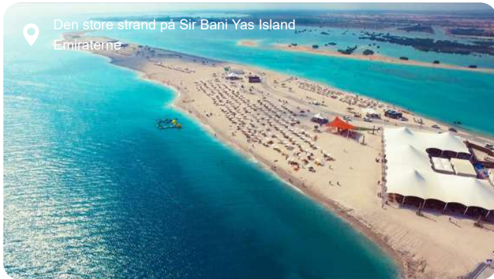
Den store strand på Sir Bani Yas Island Emiraterne