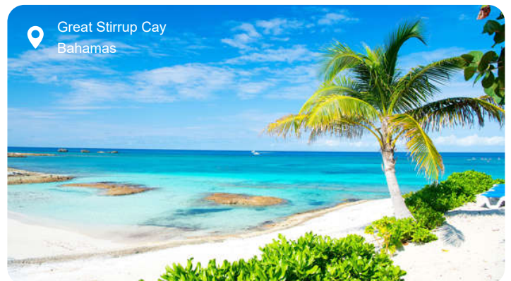
Great Stirrup Cay Bahamas

På Great Stirrup Cay bliver du sat i land på en ø, hvor alt kredser om havet. Stranden bugter sig med hvidt sand og vand i nuancer af turkis, men der er mere at lave end blot at læne sig tilbage i en liggestol. Du kan snorkle blandt fisk, der svømmer i flok mellem korallerne, glide lydløst over vandet i kajak eller prøve parasailing og se hele øen fra fugleperspektiv. Inde på land fører stier dig forbi små laguner og frem til et gammelt fyrtårn, der minder om øens tid som navigationspunkt i det 19. århundrede. Men det er lyden af bølgerne, duften af saltvand og synet af pelikaner, der dykker efter fisk, som for alvor gør indtryk - her mærker du Bahamas i sin enkleste form.