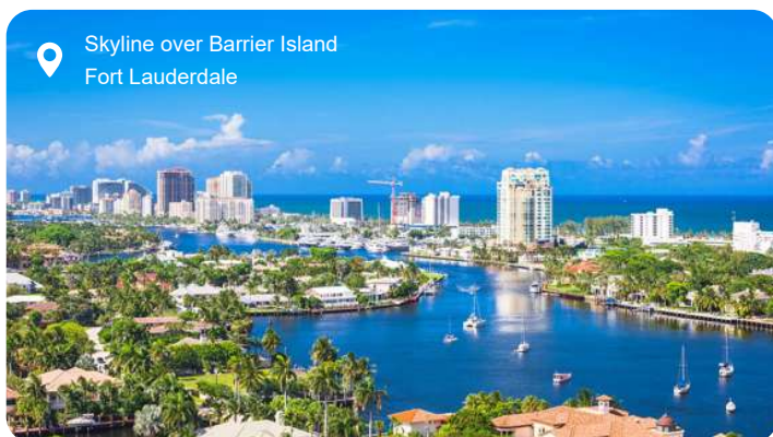
Skyline over Barrier Island Fort Lauderdale