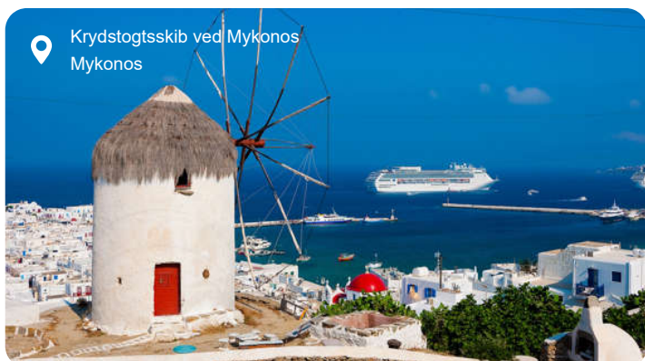
Krydstogtsskib ved Mykonos Mykonos