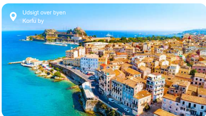
Udsigt over byen Korfu by