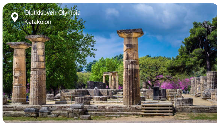
Oldtidsbyen Olympia Katakolon

Katakolon er en lille, solbeskinnet havneby på den græske vestkyst, hvor blå skodder og duftende citrus træder frem mod hvidkalkede mure. Her emmer det af middelhavsstemning, men byen er især kendt som porten til oldtidens Olympia – det sagnospundne sted, hvor de olympiske lege blev født for næsten 3.000 år siden. På en dagsudflugt kan du vandre i skyggen af oliventræer blandt templer, søjler og stadionanlæg, hvor atleter engang kæmpede for gudernes gunst. Museet i Olympia rummer fine skulpturer og fund, der bringer antikkens verden helt tæt på. Tilbage i Katakolon venter små butikker med lokale specialiteter, håndlavede smykker og flasker med den kraftige, sødlige vin fra nærliggende vingårde. Du kan nyde friskfanget blæksprutte og grillet fisk på en taverna med udsigt over det turkisblå hav eller gå en tur langs molen, hvor fiskerne reparerer deres net i solen. Har du lyst til at udforske mere, ligger sandstrandene blot få minutter væk, og bag dem strækker det græske landskab sig ud med vinmarker, pinjetræer og varme vinde.