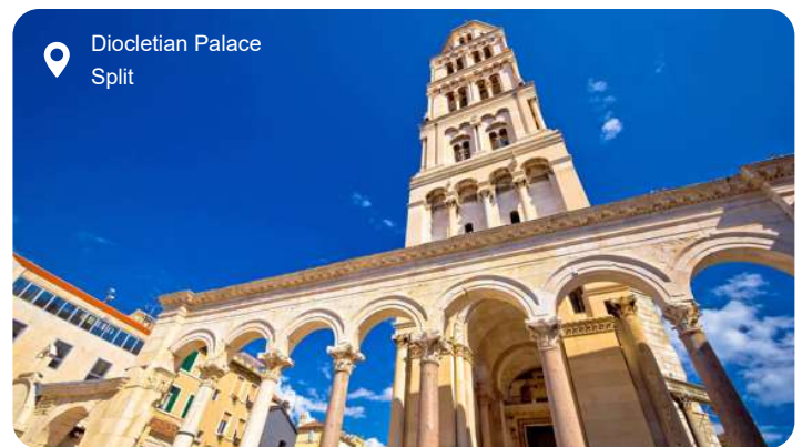
Diocletian Palace Split

Den livlige, kroatisk kulturby Splits fortryllende, gamle bykerne kan spore sine rødder tilbage til Antikken, hvor Split var under romersk herredømme. Her forenes fortid og nutid med romerske paladser på den ene side og moderne arkitektur og butikker på den anden. Omdrejningspunktet i den gamle bydel er den romerske kejser Diocletians palads med 16 tårne og 3 templer fra år 295. Paladset er siden ombygget og tilpasset flere gange af efterkommende herskere og ligger i dag meget tæt på Rivaen – den pulserende og fashionable, palmefyldte gade ved vandet, hvor du finder butikker og caféer og kan beskue det lokale liv. Yndede udflugtsmål fra Split inkluderer de gamle byer Solin og Trogir med mange levn fra Antikken og Krka Nationalpark med smukke vandfald, vandmøller og betagende landskaber.