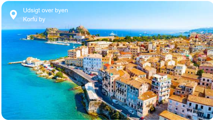
Udsigt over byen Korfu by