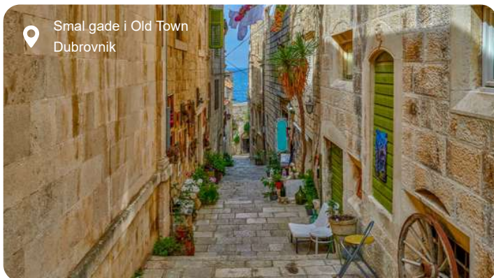
Smal gade i Old Town Dubrovnik