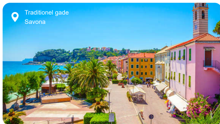
Traditionel gade Savona

Den norditalienske havneby Savona bliver tit overset til fordel for nærliggende og mere velklingende byer som Genova og Albenga. Men Savona, der engang var Christopher Columbus' hjem, har masser af interessante attraktioner at fremvise. Slentr en tur på havnen, hvor bådene spænder bredt fra dyre yachts, hvor der sippes champagne, til gammeldags fiskerbåde, hvor besætningen reparerer deres net. Fra havnen kan du også se flere af byens seværdigheder på afstand. Den gamle bydel fra Middelalderen er hyggelig og rummer udover caféer og små butikker også flere flotte paladser, kirker og vagttårne fra den gamle bymur. Er du Apple fan, må du ikke misse All About Apple museet, der har samlet eksemplarer af stort set samtlige Apple produkter, der er produceret siden starten i 1976.