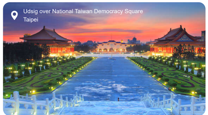
Udsigt over National Taiwan Democracy Square Taipei

Mørkegrønne bjergskrånninger omfavner havnen i Keelung, hvor skyskrabere, templer og fiskehaller spejler sig i det skiftende lys over havet. Ved havnefronten blander duften af saltvand og frisk fisk sig med røgelse fra det smukke Dianji-tempel, hvis røde søjler og gulddetaljer danner en fredfyldt kontrast til det livlige bybillede. En udflugt til det særprægede Yehliu Geopark vest for byen fører dig til et landskab, hvor vind og hav har skabt klippeformationer, der ligner skulpturer – heriblandt den berømte "Queen's Head". Ikke langt fra Keelung ligger Taipei, som nås på under en time med tog og åbner døren til Taiwans moderne puls og kulturelle dybde. Her kan du besøge det storslåede National Palace Museum, der rummer en af verdens fineste samlinger af kinesisk kunst, eller tage elevatoren op i Taipei 101 og skue ud over storbyen fra det ikoniske tårns 89. etage. Chiang Kai-shek Memorial Hall og Longshan-templet vidner om øens dramatiske historie og spirituelle rødder, mens grønne oaser som Elephant Mountain og Da'an Park inviterer til ro og udsigt. Keelung fungerer som et stemningsfuldt udgangspunkt, hvorfra både kystens naturkræfter og hovedstadens kulturskatte kan opleves.