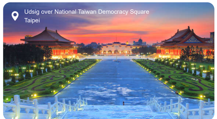
Udsigt over National Taiwan Democracy Square Taipei

Mørkegrønne bjergskrånninger omfavner havnen i Keelung, hvor skyskrabere, templer og fiskehaller spejler sig i det skiftende lys over havet. Ved havnefronten blander duften af saltvand og frisk fisk sig med røgelse fra det smukke Dianji-tempel, hvis røde søjler og gulddetaljer danner en fredfyldt kontrast til det livlige bybillede. En udflugt til det særprægede Yehliu Geopark vest for byen fører dig til et landskab, hvor vind og hav har skabt klippeformationer, der ligner skulpturer – heriblandt den berømte "Queen's Head". Ikke langt fra Keelung ligger Taipei, som nås på under en time med tog og åbner døren til Taiwans moderne puls og kulturelle dybde. Her kan du besøge det storslåede National Palace Museum, der rummer en af verdens fineste samlinger af kinesisk kunst, eller tage elevatoren op i Taipei 101 og skue ud over storbyen fra det ikoniske tårns 89. etage. Chiang Kai-shek Memorial Hall og Longshan-templet vidner om øens dramatiske historie og spirituelle rødder, mens grønne oaser som Elephant Mountain og Da'an Park inviterer til ro og udsigt. Keelung fungerer som et stemningsfuldt udgangspunkt, hvorfra både kystens naturkræfter og hovedstadens kulturskatte kan opleves.