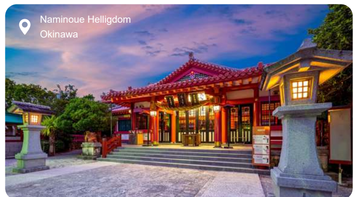
Naminoue Helligdom Okinawa

Okinawa er Japans tropiske øgruppe, hvor havet glitrer i nuancer af turkis og blå, og palmeklædte strande danner kontrast til den krigshistorie og særprægede kultur, som præger øen. Her lægges der til i hovedbyen Naha - en moderne, men charmerende storby med skyskrabere, monorail og mindesmærker, der vidner om øens dramatiske fortid. Under Anden Verdenskrig blev byen næsten jævnet med jorden under det blodige slag om Okinawa, hvor titusindvis af civile mistede livet. Du kan stadig gå gennem de smalle tunneler under jorden, hvor den japanske hærs hovedkvarter lå, og se de spartanske rum præcis som de blev forladt. Historien stopper dog ikke her. Okinawa var tidligere hjem for det selvstændige Ryukyu-rige, og øens kulturelle særpræg lever videre i maden, musikken og arkitekturen. Hele ni steder på UNESCO's verdensarvsliste fortæller om denne arv, heriblandt det rødglødende Shuri-slot, det fredfyldte Tamaudun-mausoleum og Shikinaen-haven med sine buede tage og lotusdamme. Du kan også tage uden for byen og opleve koralrev, havskildpadder og landsbyer, hvor der stadig spilles på det traditionelle strengeinstrument, shamisen, og kvinder væver i hånden. Okinawa føles som Japan i en blødere udgave - med egen identitet, et varmt hai sai i stedet for det formelle konnichiwa , og en historie, der går dybt under huden.