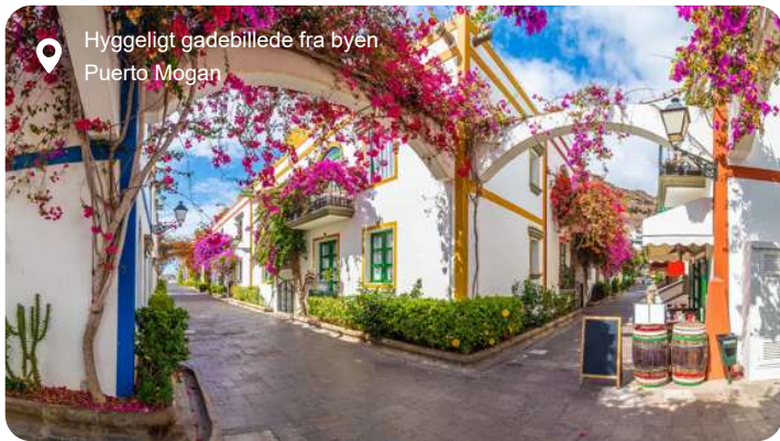
Hyggeligt gadebillede fra byen Puerto Mogan