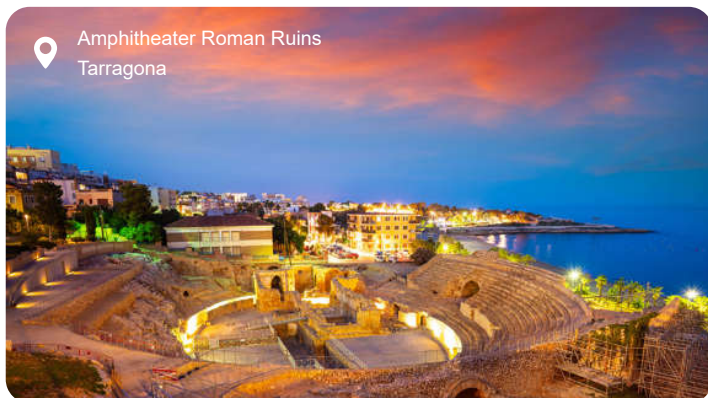
Amphitheater Roman Ruins Tarragona