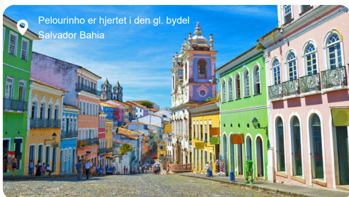
Pelourinho er hjertet i den gl. bydel Salvador Bahia

Salvador de Bahia er en af Brasiliens største byer. Her smelter flere kulturer sammen og sætter sine aftryk på maden, musikken og dansen. Byen er kendt for sin særlige koloni-arkitektur og pastelfarvede bygninger, og du vil føle dig hensat til det 17. århundrede, når du bevæger jer rundt i det bakkede og brostensbelagte historiske Pelourinho distrikt, der er optaget på UNESCO's verdensarvsliste og betegnes som Salvadors bankende hjerte. Der findes mere end 300 kirker i Salvador. Blandt de mest overdådige og uforglemmelige er São Francisco kirke og kloster med udsmykkede lysekroner, udskæringer i bladguld og fantastiske loft-til gulv freskoer af autentiske portugisiske fliser. Du finder også en af verdens ældste elevatorer i Salvador i form af Elevador Lacerda, der er en del af en eminent Art Deco konstruktion og transporterer dig 60 m op i luften, så du kan nyde udsigten over byen.