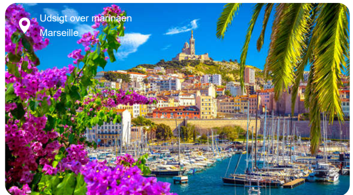
Udsigt over marnaaen Marseille

Marseille er den største havn i Middelhavet og Frankrigs andenstørste by. Den er en sand smeltedigel af forskellige folk og kulturer og anses for at være en bro mellem Europa og Nordafrika. Det er en by, der er perfekt til bare at vandre omkring og indsnuse atmosfæren, mens man beundrer de arkitektoniske perler. I den maleriske gamle havn ligger yachts- og fiskerbåde side om side, og lige nord herfor finder du den historiske del af byen, Le Panier, hvis virvar af snørklede og stejle gader gemmer på små, skjulte pladser og gamle, høje huse med terrasser, hvor vasketøjet hænger til tørre. Ud for kysten domineres vignet af det berygtede Château d'If – fængslet på en lille klippeø, hvorfra Greven af Monte Cristo flygtede i Alexandre Dumas' berømte roman. Fra Marseille kan du også udforske smukke og historisk interessante Arles og pavernes gamle by Avignon.