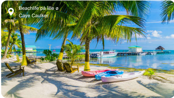
Beachlife på lille ø Caye Caulker