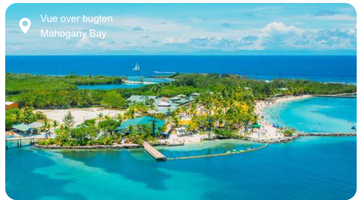
Vue over bugten Mahogany Bay

Belize City emmer af caribisk liv og farverig blandingskultur. Byens gader rummer kolonitidens træbygninger, travle markeder og en afslappet stemning, hvor livet leves i et roligt tempo. Ved havnefronten kan du mærke rytmen af hverdagens liv, mens små caféer og boder frister med frisk fisk, tropiske frugter og den klassiske rice and beans. Et kort stykke uden for byen rejser mayaruinerne ved Altun Ha sig som et vidnesbyrd om en svunden storhedstid, omgivet af tropisk skov og eksotiske fugle. Ønsker du at opleve havets skatkammer, ligger verdens næststørste barriererev kun en kort sejltur væk, hvor snorkling og dykning byder på farverige koraller og et rigt marineliv. Belize City er et møde mellem historie, kultur og natur, og den varme blanding af kreolsk, maya- og garifuna-arv gør besøget til en oplevelse i mange lag.