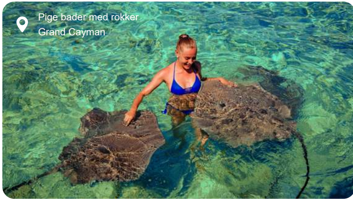
Pige bader med rokker Grand Cayman