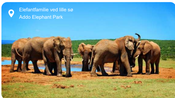
Elefantfamilie ved lille sø Addo Elephant Park