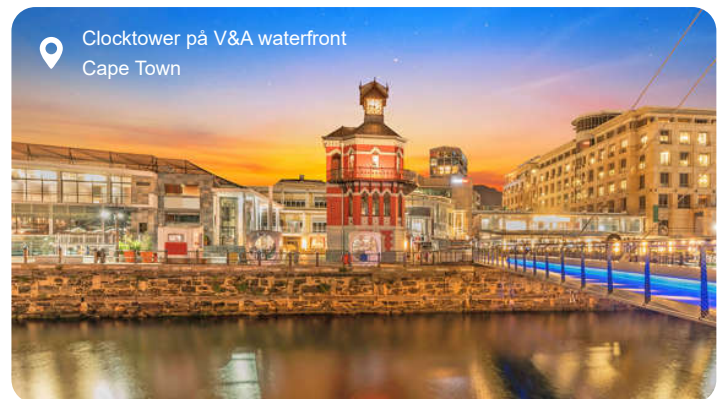
Clocktower p  V&A waterfront Cape Town

Cape Town er en af verdens mest spektakul rt beliggende byer, klemt inde mellem det ikoniske Table Mountain og det dybl  Atlanterhav. Her m des historie, kultur og natur i en farverig blanding, hvor du kan opleve alt fra det vibrerende marked p  Greenmarket Square til det stemningsfulde Bo-Kaap-kvarter med sine pastelfarvede huse og duft af krydderier fra Malay-k kkenet. En tur med sv vebanen op p  Table Mountain bel nner dig med en uforglemmelig udsigt over byen og bugten, mens en b dtur til Robben Island fort ller den st rke historie om Nelson Mandela og kampen mod apartheid. Langs kysten venter dramatiske naturscenerier og hyggelige strandbyer som Camps Bay og Hout Bay, og f lger du Chapman's Peak Drive, snor vejen sig langs klippesider h jt over havet med stop ved udsigtspunkter, hvor du n rmest taber vejret. Du kan ogs  tage til Kap Det Gode H b, hvor de to verdenshave m des i et brus af b lger, og hvor du m ske m der strudse og bavianer p  din vej. P  hjemturen frister vinlandet med frodige vinmarker, historiske ving rde og smagninger af sydafrikanske vine i solbeskinnede omgivelser. Cape Town er kontrastfyldt, dragende og storsl et - en by der s tter sig i b de kroppen og hjertet.