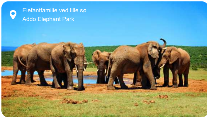
Elefantfamilie ved lille s  Addo Elephant Park

Farverig, vindblæst og med en kystlinje, der synes at strække sig uendeligt ligger Port Elizabeth - eller Gqeberha som byen officielt hedder i dag - som en port til både Det Indiske Ocean og Sydafrikas rige kulturhistorie. Langs den solbeskinnede strandpromenade ligger hvide sandstrande, surferbølger og strandcaf er p  stribe, og det milde klima g r byen til et oplagt sted at slappe af, bade eller tage p  delfin- og hvalsafari. Men Port Elizabeth er mere end ferieidyl. Byen rummer st rke fort llinger om Sydafrikas koloniale fortid og kamp mod apartheid - bl.a. i det sp ndende Red Location Museum i byens  ldre kvarterer, hvor hverdagsgenstande, fotos og lydoptagelser fort ller om undertrykkelse og modstand. Kun en times k rsel v k ligger Addo Elephant National Park, hvor du med lidt held kan opleve alle "Big Five" - elefant, l ve, b ffel, n sehorn og leopard - i deres naturlige habitat. Parken blev oprindeligt oprettet for at beskytte de sidste sydafrikanske elefanter, og i dag tr kker dens  bne landskaber, akacietr er og enorme flokke af dyr bes gende til fra hele verden. Tilbage i byen kan du g  en tur langs Route 67 - en kunst- og kulturrute med 67 kunstv rker, der hylder Nelson Mandelas  r i offentlig tjeneste - og m rke, hvordan fortid og nutid flettes sammen i en by, der stadig er i bev gelse.