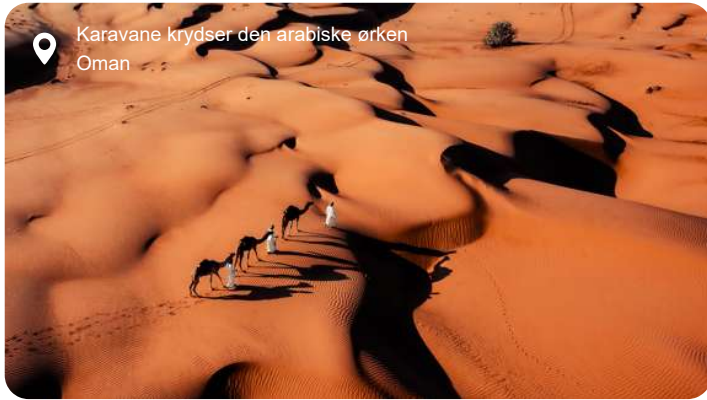
Karavane krydser den arabiske ørken Oman