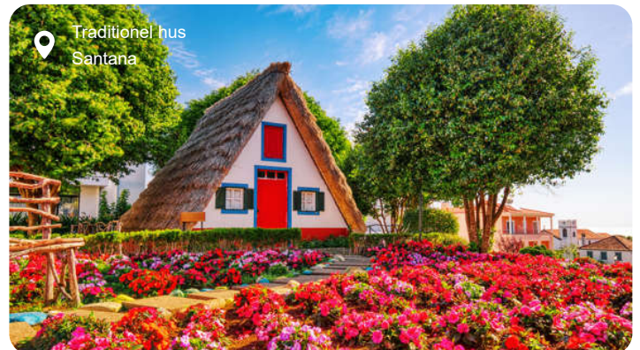
Traditionel hus Santana

Madeira er kendt for sin frodige natur og mange billedskønne landsbyer, hvoraf mange tilbyder de smukkeste panoramaudsigter. En idyllisk ø med smukke strande, fantastiske landskaber formet i lava og frodige, grønne skove. Funchal nærmest klatrer op ad bjergskråningerne mellem bananplantager og blomstrende haver, for det milde klima året rundt gør byen til en sand botanisk oase, hvor farverne fra bougainvillea, strelitzia og hortensia er næsten overvældende. Besøg de små, fredfyldte landsbyer gemt væk mellem de næsten vinkelrette bjerge. Tag f.eks. med kabelbanen op til Monte og oplev den barokke kirke med de stejle trapper for efterfølgende at suse ned ad de snoede gader i de ikoniske kurveslæder. I den gamle bydel frister de smalle gader med restauranter, kunstnerisk udsmykkede døre og den summende Mercado dos Lavradores, hvor du kan dufte og smage på eksotiske frugter, lokale oste og Madeiras berømte vin. Det er oplagt at følge en levada – de historiske vandingskanaler – på en gåtur gennem frodig natur, eller tage på hvalsafari for at møde delfiner og kaskelothvaler. Og er du fodboldfan, kan du næsten ikke komme udenom CR7 Museum, der hylder fodboldstjernen Cristiano Ronaldo, som er født på øen.